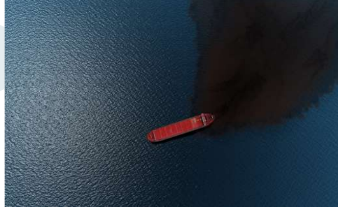
Kaynak: Proinde Brazil Pollution Liabilities in Brazil | Proinde

Hukuki tavsiye yerine geçmemesi gerekirken, pratik bir başvuru aracı olarak yararlı olacağını umuyoruz ve bu yayının güncel bir kopyasını ücretsiz olarak indirmek ve bu alanda bulundurmak için elimizden gelenin en iyisini yapacağız.